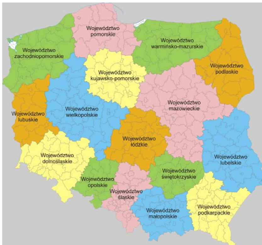
Rysunek 2. Podział administracyjny Rzeczypospolitej Polskiej

Program wprowadza się na terytorium Rzeczypospolitej Polskiej. Programem jest objęte 16 województw, w których skład wchodzi 314 powiatów oraz 66 miast na prawach powiatów.